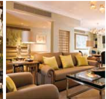
HOTEL AM SCHLOSSGARTEN STUTTGART